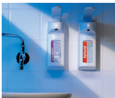
Leichte, hygienische Entnahme mit unserem Dermados-Wandspender